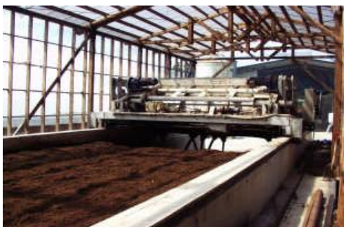
堆肥製造装置 (家畜排せつ物の強制発酵)